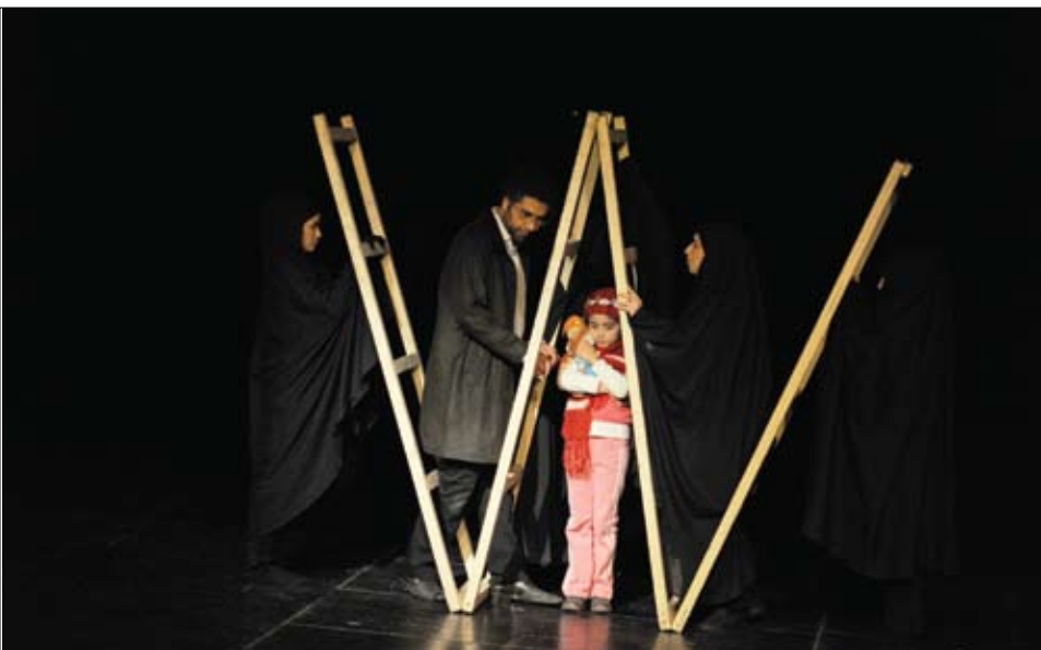
موسیقی نمایش با توجه به طراحی مینی مالیستی با استفاده از سازه‌های سم‌تار، کیبورد (پیانو)، درام (ساز افکتیو) و برخی موتیف‌های لایت برای ایجاد فضا سازی شکل گرفته است