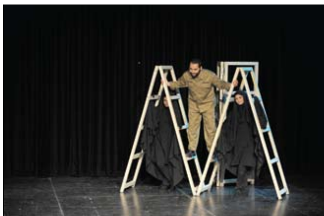
طراحی نور با توجه به نورپردازی و فضای رنالیستی و ذهنیت شاعرانه مد نظر قرار گرفته است. بیشتر نورهای با حجم کم، نورهای موضعی و همچنین تلفیق نور آبی و نارنجی استفاده شده است