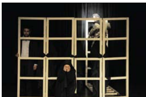
نباید به سمت ملودی رفت. موسیقی باید تلنگری به احساس بازگر بزند. این دو کارگردان با دیدگاه تصویرسازی و تاکید بر جلوه‌های بصری به دیدگاه مشترک دست یافتند