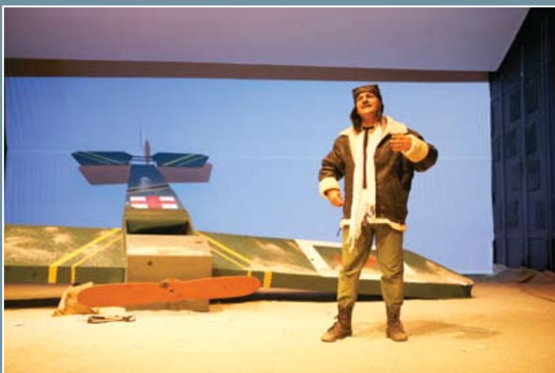
آنتوان و مسافر کوچولو