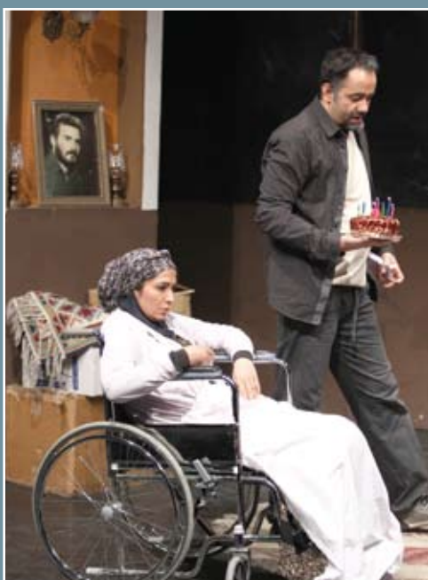
سکوت آن سه