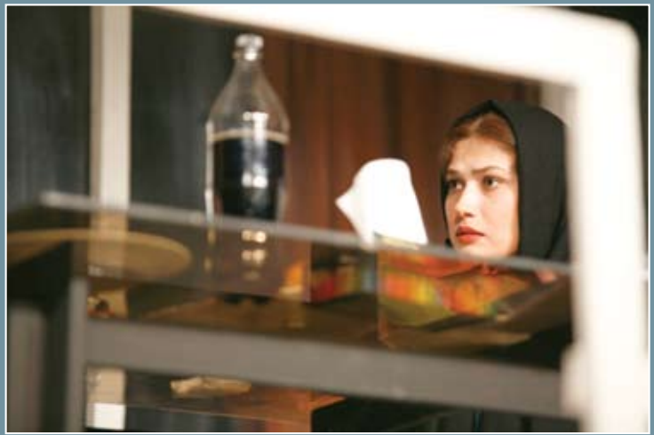
نویسنده مرده است