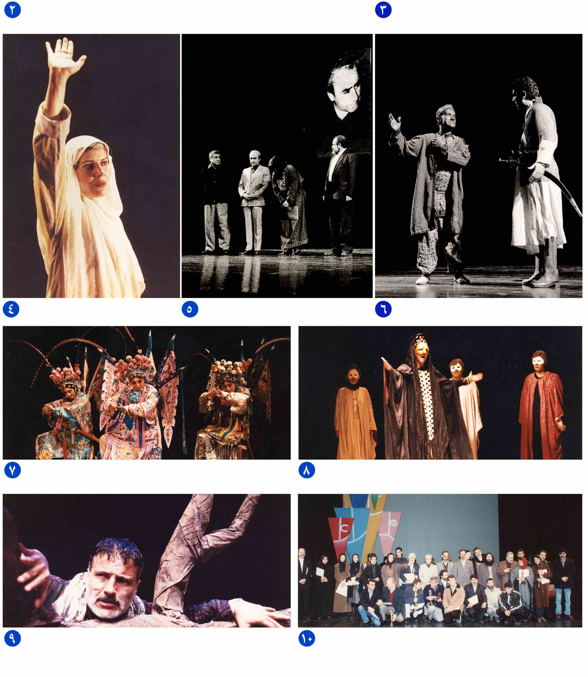
۱. نمایش «کتاب ارداویراف» به کارگردانی شاهرو کهرادماند و پاتریزا بتینی، کار مشترک ایران و ایتالیا ۲. نمایش «بانو بانگ» به کارگردانی کای رینگ زیان از چین ۳. نمایش «انتیگونه» به کارگردانی اسپروس وراخوریتیس از یونان ۴. نمایش «صالح عبدالصالح» به کارگردانی زیناتی قدسیه از فلسطین ۵. اختتامیه ۶. نمایش «بانو بانگ» به کارگردانی کای رینگ زیان از چین ۷. نمایش «کتاب ارداویراف» به کارگردانی شاهرو کهرادماند و پاتریزا بتینی، کار مشترک ایران و ایتالیا ۸. نمایش «انتیگونه» به کارگردانی اسپروس وراخوریتیس از یونان ۹. نمایش «صالح عبدالصالح» به کارگردانی زیناتی قدسیه از فلسطین ۱۰. اختتامیه